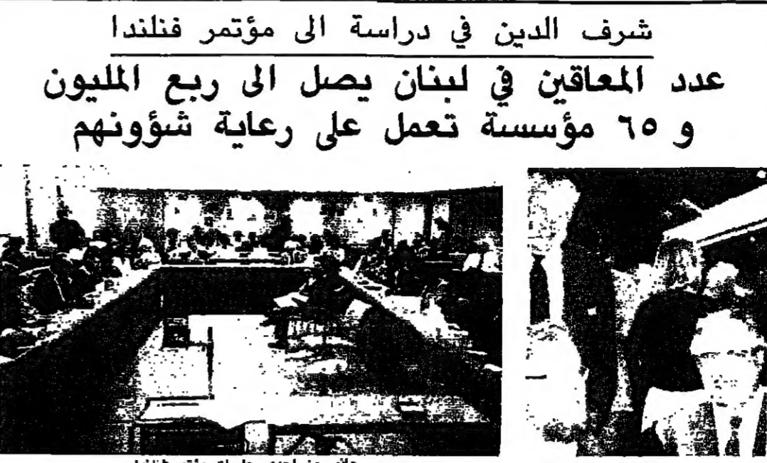
جانب من إحدى جلسات مؤتمر فنلندا